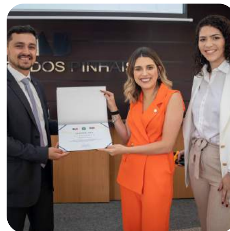
REVISTA DA ORDEM / Março de 2024 / OAB-SJP